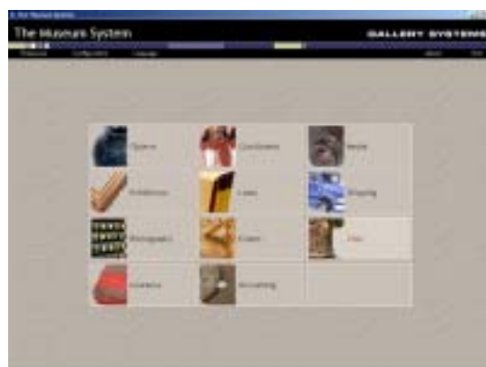
図 1．The Museum System

TMS は、データを RDB に格納する。格納されるデータは、収藏品管理情報、履歴情報等のテキストデータと、用途に応じたいくつかの解像度の画像である。また、この他に、the Getty's Art & Architecture Thesaurus (AAT) [10] と Thesaurus of Geographic Names (TGN) [11] の 2 種類のシソーラスも管理する。