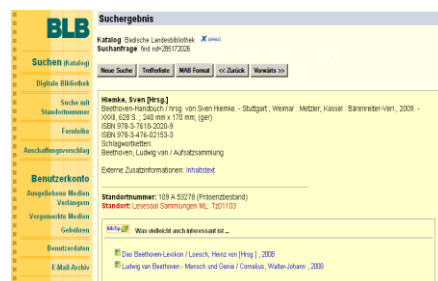
第3図 カールスルーエ大学図書館の用いる推薦システム (BibTip)